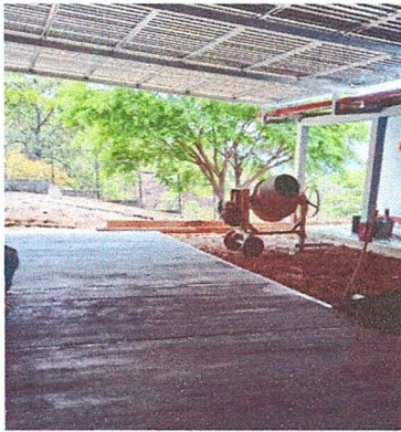
Foto 1: Los trabajos que a continuación se presentan es el avance que se realiza en la escuela la Troja.